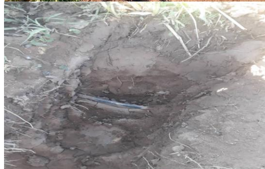
شکل ۱- نمایی از طرح پژوهشی انجام‌شده

برای محاسبه حجم آب آبیاری در سیستم آبیاری قطره‌ای، تبخیر - تعرق پتانسیل (ET o ) با استفاده از اطلاعات روزانه ایستگاه هواشناسی استان کرمان و با روش فائو پنمن - منتیث (PM) تعیین گردید (Allen et al., 1998)، سپس با استفاده از ضریب گیاهی (K c ) کلزا اصلاح‌شده برای منطقه کرمان با