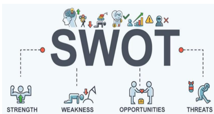
جدول ۱- ویژگی‌های فیزیکی و شیمیایی خاک مزرعه آزمایشی

هنگامی که رابطه بین هر دو بخش پیدا شود، مسیری