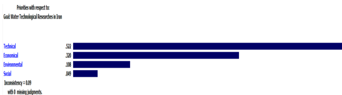
شکل ۷- رتبه‌بندی کلی معیارهای اصلی

بعد از تحلیل زیرمعیارهای مربوط به چهار بعد فنی، اقتصادی، اجتماعی و زیست‌محیطی و شناخت مهم‌ترین گزینه‌ها در هر بخش، نهایتاً نوبت به مقایسه معیارهای اصلی می‌رسد. در شکل (۷)، رتبه‌بندی کلی معیارهای اصلی ارائه شده است. همان‌طور که مشاهده می‌شود، وزن نهایی معیارهای فنی، اقتصادی، اجتماعی و زیست‌محیطی به ترتیب برابر با ۰/۵۲۲،