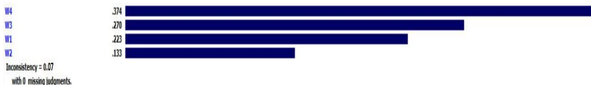
شکل ۴- رتبه‌بندی زیرمعیارهای بعد اقتصادی

Priorities with respect to: Goal: Water Technological Researches in Iran >Economic