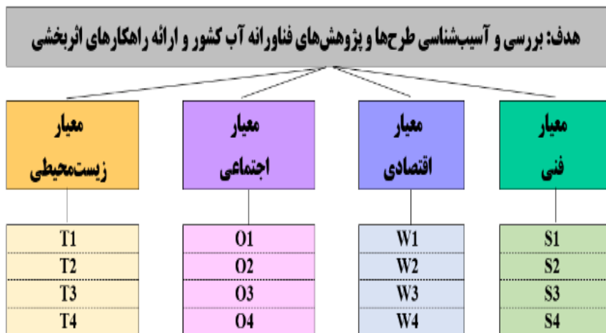
شکل ۲- ساختار و شماتیک تحلیل سلسله مراتبی (AHP) پژوهش حاضر

کلی تعیین‌شده و برای آن چهار معیار اصلی که شامل فنی، اقتصادی، اجتماعی و زیست‌محیطی است، در نظر گرفته شد. لازم به ذکر است که انتخاب معیارها و زیرمعیارها (گزینه‌ها) کار بسیار