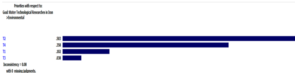
شکل ۶- رتبه‌بندی زیرمعیارهای بعد زیست‌محیطی

رتبه‌بندی زیرمعیارهای بعد زیست‌محیطی (T) نشان داد که گزینه‌های برتر آن به ترتیب T2، T4 و T1 است (شکل ۶). با توجه به اینکه فناوری‌های صنعت آب به‌ویژه آن‌هایی که در امر تصفیه وجود دارند، ذاتاً پسماندی را تولید می‌کنند، این مورد یعنی زیرمعیار T2 یا "تولید حداقل پسماند و ضایعات" مورد توجه ویژه متخصصین بوده و بیشترین امتیاز (۰/۵۰۳) را کسب کرد. معقول است که برترین گزینه، ارتباط نزدیکی با محیط پیرامون دارد. از طرفی ضمن اینکه فناوری مورد نظر باید از نظر فنی و اقتصادی توجیه‌پذیری داشته و از نظر اجتماعی مورد مقبول عموم قرار گیرد، اما از سوی دیگر باید به مباحث زیست‌محیطی توجه ویژه‌ای داشت. در تکمیل موارد فوق و ب یک روند کاملاً منطقی، زیرمعیار T4 یا "سوخت پاک" نیز رتبه دوم را با امتیاز ۰/۳۵۸ کسب کرد. اینکه یک فناوری از سوخت‌های پاک و انرژی‌های نو استفاده کند، باید مورد توجه مسئولین امر باشد. زیرمعیار T1 یا "استفاده از آب‌های نامتعارف" گزینه‌ای است که حتی می‌توانست امتیاز بیشتر از ۰/۱۰۲ و جایگاه بهتری را کسب کند اما به‌رحال گزینه‌های