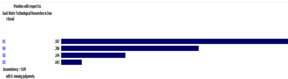
شکل ۵- رتبه‌بندی زیرمعیارهای بعد اجتماعی

بهتری در صدر قرار گرفتند. زیرمعیار T1 بدین معنی است که اگر فناوری مورد نظر از آب‌های نامتعارف و آلوده برای مصارف مختلف استفاده کند، مقبولیت و مشروعیت بیشتری خواهد داشت. در نهایت زیرمعیار T3 یا "سازگاری با اقلیم" با وزن ۰/۰۳۸ در جایگاه چهارم قرار گرفت و آخرین گزینه معیار زیست‌محیطی شد. نرخ ناسازگاری در معیار اجتماعی برابر با ۰/۰۸ به دست آمد که در محدوده مجاز قرار دارد (شکل ۶). مهم‌ترین نقطه تهدید شناسایی‌شده در مرحله قبلی، "بروکراسی اداری و عدم تسریع فرایند ثبت اختراع و استفاده از فناوری" بود. این یعنی تبدیل تهدید به فرصت و موفق شدن فناوری‌ها و اجرایی شدن آن، باید بر بروکراسی اداری غلبه کرد؛ بنابراین از دید زیست‌محیطی در نظر گرفتن گزینه‌های به ترتیب تولید حداقل پسماند و ضایعات، سوخت پاک، استفاده از آب‌های نامتعارف و سازگاری با اقلیم، تضمین‌کننده موفقیت پروژه‌هاست. در همین رابطه، گودرزی (۱۴۰۱)، موسوی و همکاران (۱۴۰۲) و فقیهی و جهان‌تبیغ (۱۴۰۲)، توجه به معیار زیست‌محیطی و اهمیت آن در پروژه‌ها تأکید داشتند.