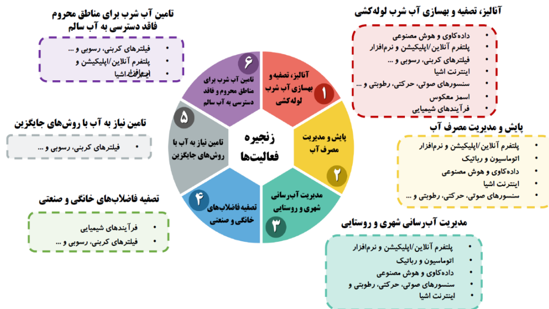
شکل ۱- فناوری‌های موردنیاز به تفکیک جایگاه در زنجیره فعالیت‌ها

با بخش آب، شرکت و کارخانه‌ها و هر شخص یا شرکتی که به تولید و ساخت فناوری‌های کاربردی برای حل مشکل بحران آب پرداخته است، می‌باشد. البته به شرطی که فناوری مذکور، ارزش و قابلیت اجرا را داشته و تأثیر زیادی در مدیریت، کنترل و مصرف بهینه آب در گروه‌های مصرف‌کننده (شرب، کشاورزی، صنعت و محیط‌زیست) ایجاد کند؛ بنابراین اطلاعات موردنیاز برای دسته‌بندی و تحلیل و تفسیر وضعیت موجود و همچنین استفاده از نرم‌افزارهای مربوطه که خروجی آن منجر به ارائه راهکارهای